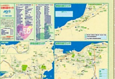
小樽青年会議所 『とっさに役立つ 小樽公園マップ』