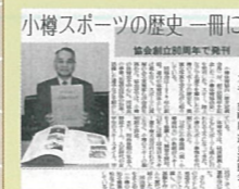
小樽スポーツの歴史一冊に 協会創立80周年で発行 読売新聞掲載

2月16・17日の二日間にわたり日専連ビル7Fにて、街の電器店と工務店が手を組んでの大規模な企画となりました。