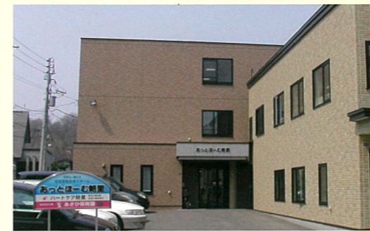
住宅型有料老人ホーム