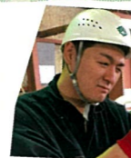
パネルチーム 千葉 です。

以前は水産食品の製品管理や、配関関係の仕事をしていました。転職するにあたりそれなりの覚悟と心構えをしていたつもりですが、入社以来見る物や使用する物のほぼ全てが初めてで、自分の甘さを痛感しております。それでも日々仕事を教わりながら、諦めず地道に身につけていきたいと思っております。自分の為に根気よく親切丁寧に教えてくださる先輩方々の期待にこたえられるよう、これからも頑張りますのでどうぞ宜しくお願い致します。