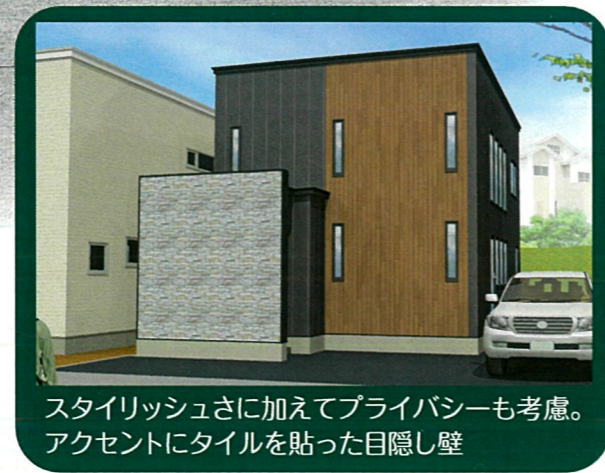
スタイリッシュさに加えてプライバシーも考慮。 アクセントにタイルを貼った目隠し壁