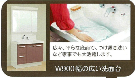
広々、平らな底面で、つけ置き洗い など家事でも大活躍します。