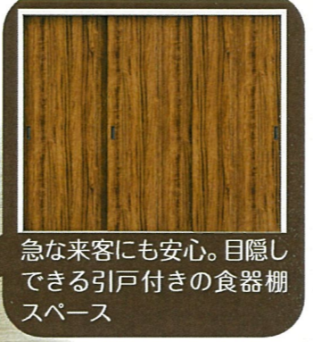
急な来客にも安心。目隠し できる引戸付きの食器棚 スペース