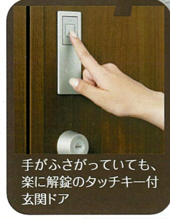
手がふさがっていても、 楽に解錠のタッチキー付 玄関ドア