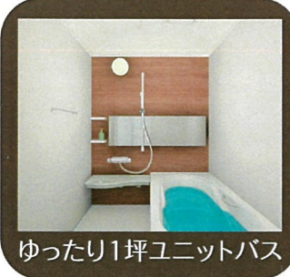
PCコーナーに、 家事コーナーに、 用途いろいろな カウンター