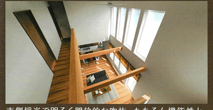
南側採光で明るく開放的な吹抜。もちろん機能性と デザイン性を兼ね備えたシーリングファン付