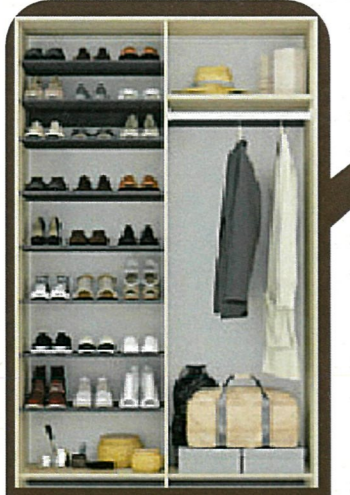
大容量シュークロークは、 靴だけではなく除雪道具 やタイヤなども納まり、 玄関は下駄箱いらずで スッキリ