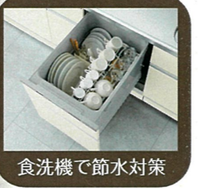
食洗機で節水対策