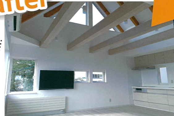
居間と台所の壁と天井を撤去し、梁を表しにした吹き抜け空間に改修。広々としたゆとりある空間に変貌しました。