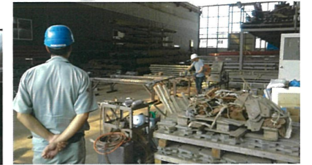
明確な搬入路がなく、作業を中断しなければ搬入できない作業場