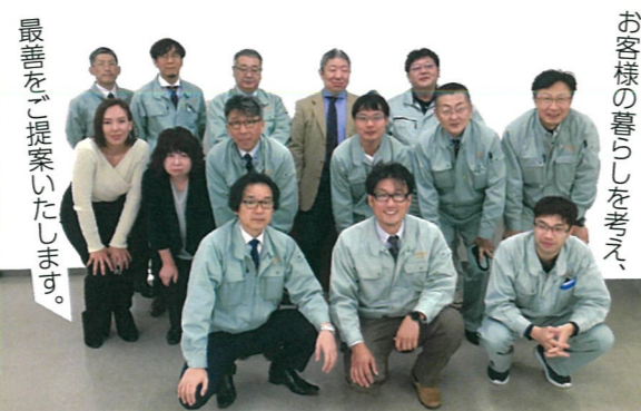
最善をご提案いたします。