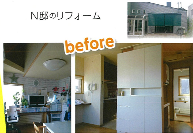
居間、台所がそれぞれ壁に囲まれており、上部には部屋があったので、各々の部屋が狭く、少々窮屈な空間となっています。