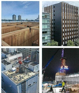
テレビ塔から眺めた 工事風景