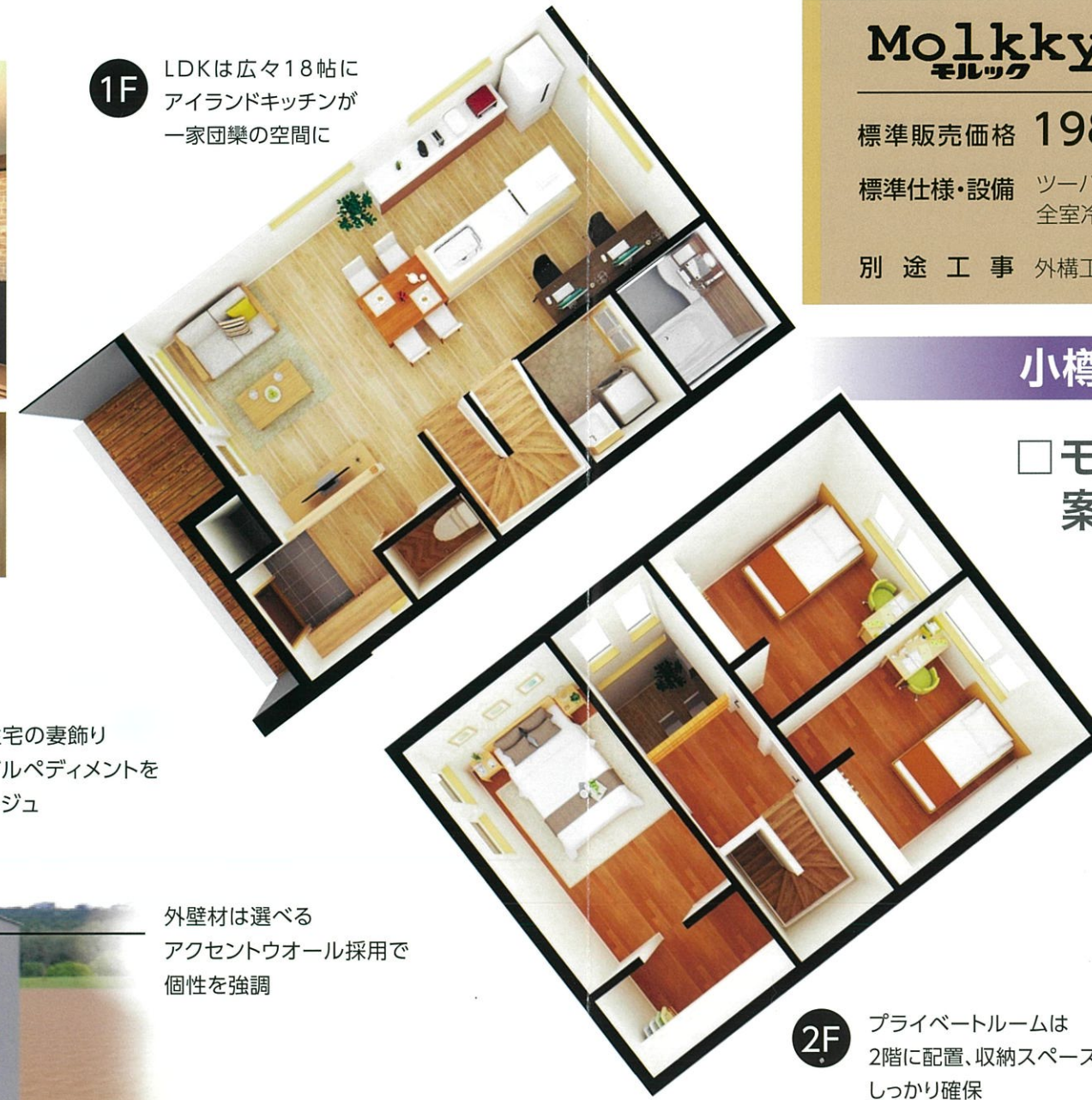
2F プライベートルームは2階に配置、収納スペースもしっかり確保