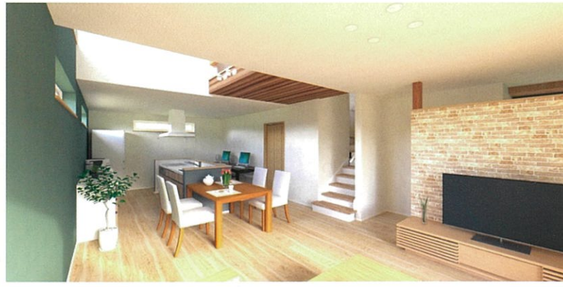
1F LDKは広々18帖にアイランドキッチンが一家団樂の空間に